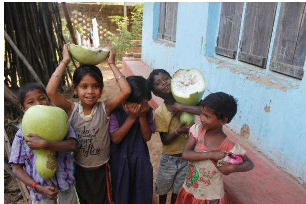
स्कूल के बाग में उगाई हुई लौकी की फसल

गौतम से बच्चे तकली और चरखा चलाना बहुत रुचि से सीखने हैं। वे नियमित रूप से अपने कपड़ों की मरम्मत करते हैं। इसके लिए वो जोड़ियों या छोटे समूहों में, या तो किसी कक्षा या फिर स्टोर-रूम में जाते हैं। बच्चे कढ़ाई काम भी करते हैं जिसे उनके बस्तों या रूमालों पर देखा जा सकता है।